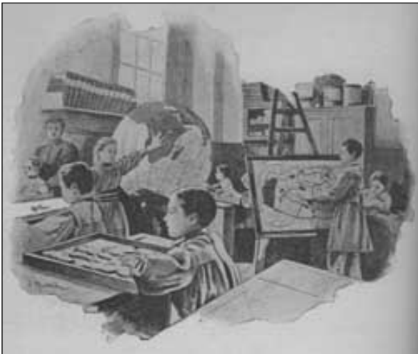
Resim 1. K rlerin eğitimi iin  zel kabartma haritalarla yapılan Coğrafya dersleri

mayanlar ise, hasır  rmek, hasır veya ip ile kamıř sandalyeleri d flemek, elek ve tel ubuklarla  r lm fl eřitli eflya imaline y nlendiriliyorlardı.