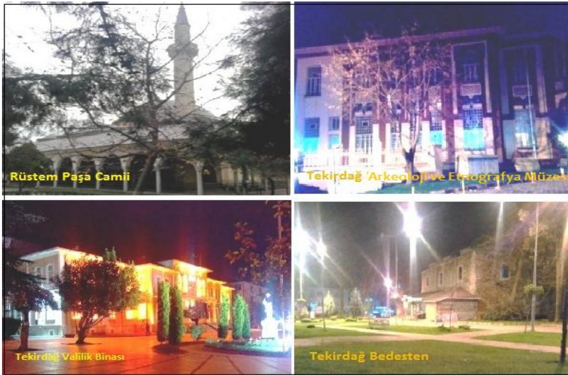
Resim2: Tekirdağ'da turizm değeri olan çok sayıda tarihi eser yer almaktadır.

Malkara'da yer alan Gazi Ömer Bey Camii ve Türbesi ise 1493-1494 yıllarına aittir. Yine Hacerzade İbrahim Bey Camii 1406 tarihinde yapılmıştır. Marmara Ereğlisi ilçesinde yer alan Cedid Ali Paşa Camii'sinin tarihi 1870'dir. Muratlı'da yer alan Atatürk evi 1936 tarihine aittir. Saray ilçesinde yer alan Ayaz Paşa Camii 1529'da yapılmıştır. Ayrıca Tekirdağ'da pek çok çeşme, köprü, hamam, kale ve tümülüse ait turizm bakımından değer arz eden eser yer almaktadır (Keskinel, Özdemir, Öztürk, Güven, Meriç, Demirkıran, Erdem, Ayber, Şahin, Çelik, 2014). Tekirdağ'da çok sayıda kültüre ait tarihi eser bulunmasında ilin coğrafi konumu nedeniyle asırlar boyu çeşitli medeniyetlere ev sahipliği yapması yatmaktadır. Nitekim il ulaşım bakımından önemli merkezleri birbirine bağlayan yolların geçtiği bir konuma sahiptir ve bu nedenle önemli bir ulaşım merkez konumundadır. M.Ö. 2 yy. ait olan Roma İmparatorluğu'nun doğusunu ve batısını birbirine bağlayan Via Egnatia Yolu, Malkara ve Marmara Ereğlisi'nden geçmektedir. Yine Kanuni Sultan Süleyman'ın Viyana seferine çıktığı Sultanlar Yolu şehirden geçmektedir (Demir, Yücel, Kiper, Düşünen, Çalık, Uzun, Altaş, Kutan, 2013 s.32-40).