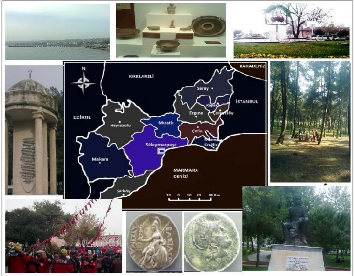
Resim 1: Tekirdağ'ın turizmi üzerinde tarihi eserlerin yanında doğal güzellikler de etkilidir.

Tekirdağ tarihi özellikleri ile de turizme etkilemektedir. Tekirdağ'ın il merkezi olan Süleymanpaşa ilçesinde yer alan Tekirdağ Müzesi'nde arkeoloji ve etnografya üzerine pek çok değerli eser sergilenmektedir. Ayrıca pek çok anıt eser ile Tekirdağ, turizme destek sağlamaktadır. Bunların önemlilerinden Rüstem Paşa Camii halen kullanılmakta olup tarihi 1553' gitmektedir. Ayrıca Orta Cami, Zahir Nazırı Ahmet Ağa Cami, Rüstem Paşa Bedesteni, Yalı Hamamı, Valilik binası, Eski Belediye Binası, Rakoczi Müzesi, Namık Kemal Evi, İl Kültür ve Turizm Müdürlüğü Binası tarihi dokuya tanıklık eden anıt eserlerdir. Çorlu'da Çorlu Kalesi ve Misinli Kalesi yer almaktadır. Bunlar gibi Çorlu'da yapım tarihi 1453'e kadar giden Fatih Camii ve yapım tarihi 1521 olan Süleymaniye Camii yer almaktadır. Yine Burmalı Camii, Eski Belediye Binası, Adliye Binası ve İstasyon binası gibi daha yakın tarihlere ait çok sayıda eser yer almaktadır. Hayrabolu'da Güzelce Hasan Bey Camii'nin ibadete açılış tarihi 1499 yılına kadar giderken Çorumi Mustafa Bey Camii'nin tarihi 1687'ye, Çelebi Mehmet Paşa Camii'nin tarihi 1899'a ve Ömer Efendi Camii'nin tarihi 1404'e kadar gitmektedir.