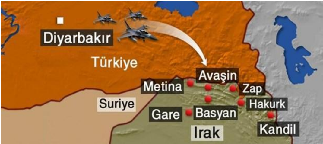
Şekil 3.1: Kuzey Irak da ki PKK kamplarına hava harekatı