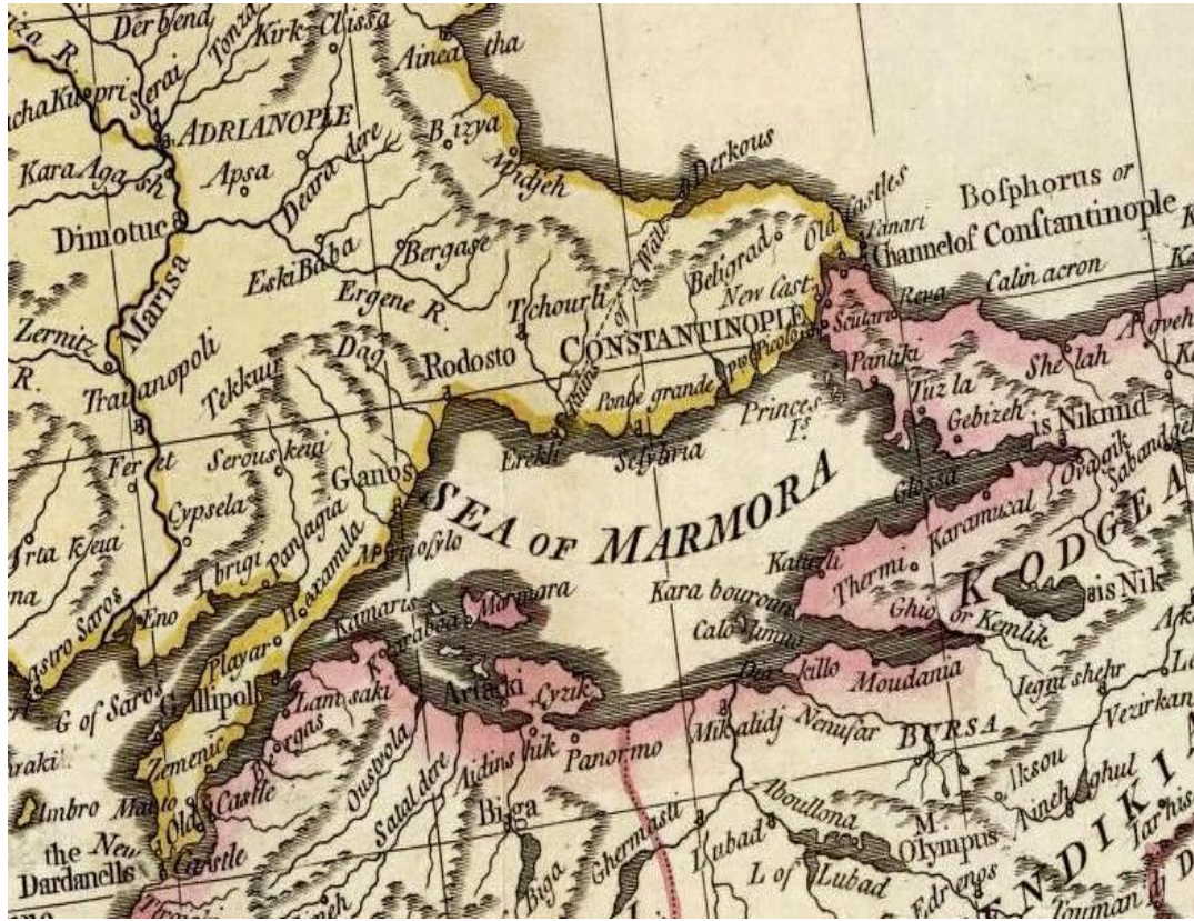
Harita 3: Bizans Dönemi'nde Trakya