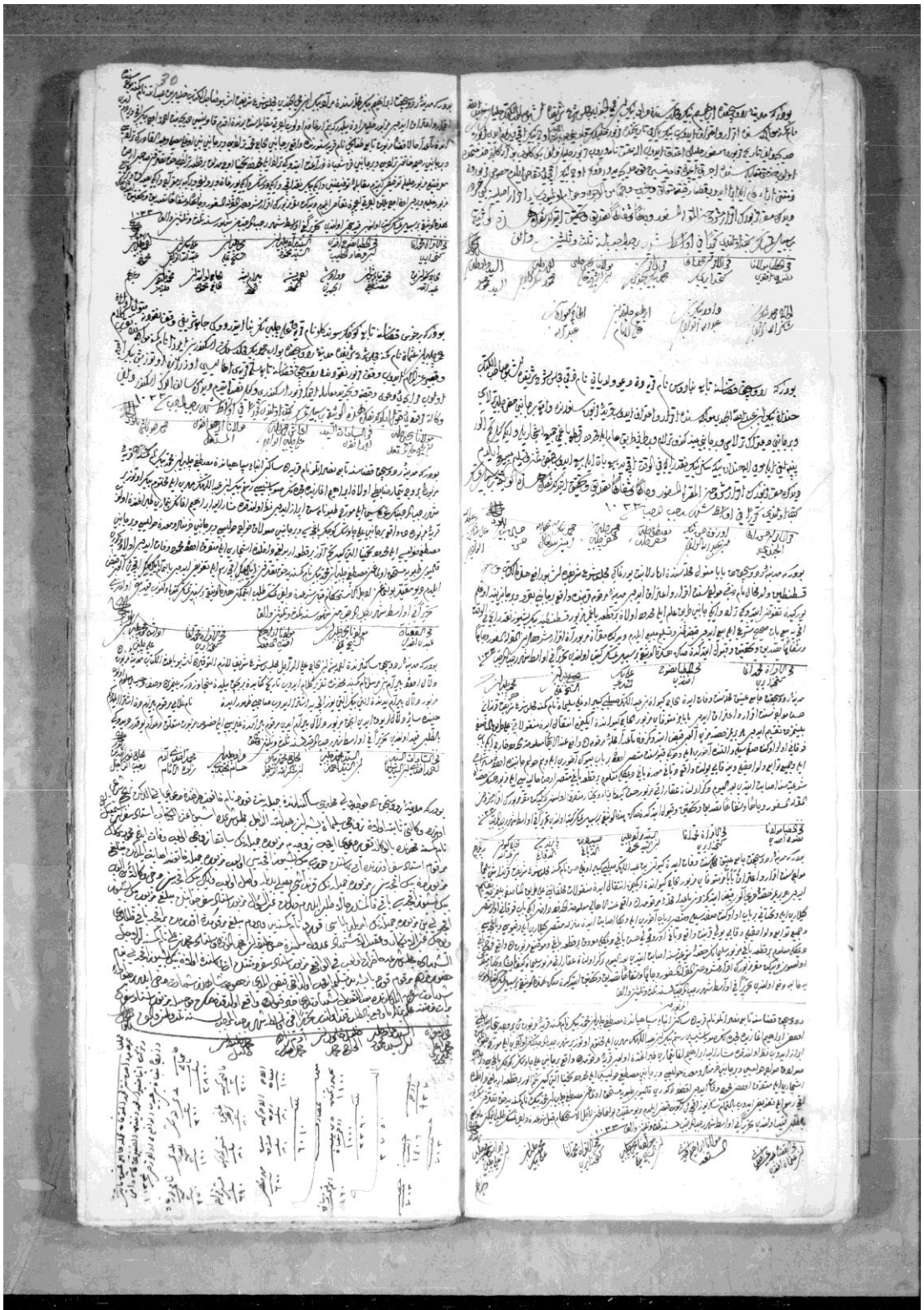
Ek 2: : R.Ş.Ş., no. 1531, vr. 29b/30a