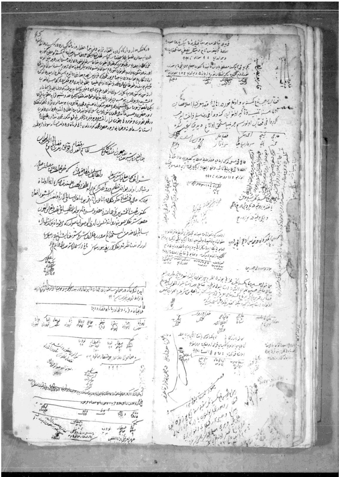
Ek 3: : R.Ş.Ş., no. 1531, vr. 44b/45a