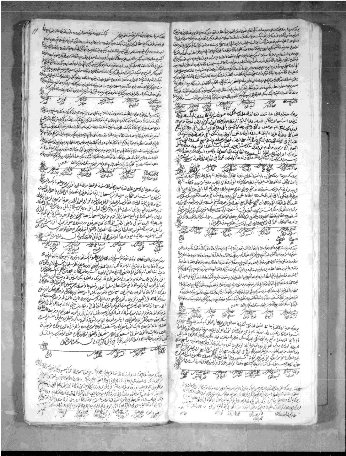
Ek 1: R.Ş.Ş., no. 1531, vr. 10b/11a