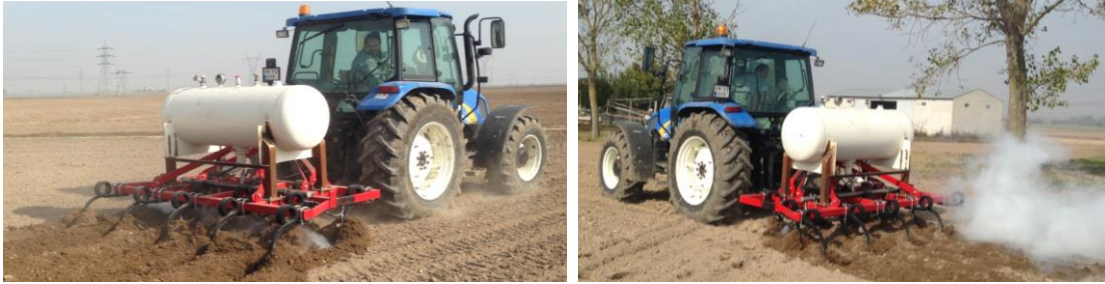
Şekil 1. Susuz amonyak uygulama ekipmanı

Araştırma kapsamında tasarlanarak hayata geçirilen ekipmana ait resimler Şekil 1'de gösterilmiştir.