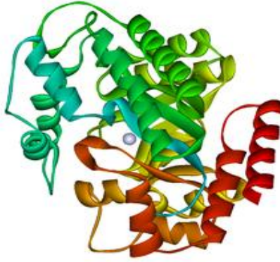
Şekil 2.1. Adenozin Deaminaz Enzimi. Adenozin deaminazın kristal yapısı. Ortadaki gri küre çinko iyonu.

Adenozin deaminaz (ADA), pürin metabolizmasında görevli olup, geri dönüşsüz bir reaksiyonla adenozinin ve deoksiadenozinin sırasıyla inozine ve deoksiinozine dönüşümünü katalizler. (Cristalli ve diğ. 2001). Enzim alfa e beta ikincil yapılar içerir. Alfa heliks yapılar daha çok periferde yer alırken beta tabakalar daha çok iç bölgede bulunmaktadır. Enzimin aktif merkezinde kofaktör olarak çinko iyonu bulunur. (Şekil 2.1). (Cooper ve diğ. 1997). Çinko atomu bu bölgede His15, His17, His214, Asp295 aminoasitleri ile ilişkilidir. ADA geni 20. Kromozomun uzun kolunda (q) lokalizedir.