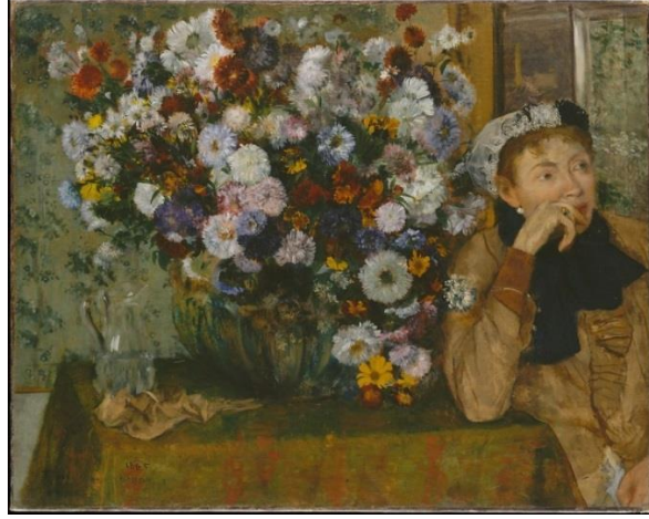
Şekil 6. A Woman Seated Beside a Vase of Flowers, Edgar Degas, Yağlıboya, 73.7 x 92.7 cm, 1865, The Metropolitan Museum of Art ( www.metmuseum.org/art/collection/search/436121 ).