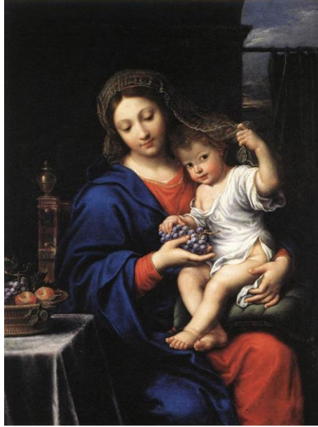
Şekil 11. The Virgin with grapes, Pierre Mignard, Yağlıboya, 121 x 94 cm, 1640’lar, Louvre Müzesi, Paris ( https://commons.wikimedia.org/wiki/File:Pierre_Mignard_-_The_Virgin_of_the_Grapes_-_WGA15663.jpg )

Eski Ahit metinlerinde, şarap ve üzüm şarabı üzerinden İsa’ya atıfta bulunan pek çok âyet vardır. Bu âyetler İsa’nın kanı ile şarap arasında sembolik bir benzerlik ifade eder. Matta 26: 27-30, Markos 14: 23-25 ve Luka 22: 17-20’deki ayetlerde geçen şarap, İsa’nın çarmıha gerilmeden önce havarileri ile yediği son akşam yemeğinde ( Havarilerin Komünyonu ) İsa’nın kanını simgeler ve ayetlerde bu açıkça belirtilmiştir. Asma ve şarabın cennet bahçesi ile ilişkilendirilmesi Yahudi geleneklerinde mevcuttur. Bu gelenekler, bahçenin sakinlerinin kullanımı için bahçeden bir şarap nehrinin aktığını ve “Bilgi Ağacı”nın bir asma olduğunu ileri sürer. Tufandan sonra Nuh’un diktiği asmanın da cennet bahçesinden geldiği düşünülmüştür. (Kaya Zenbilci, 2020b, s. 120-121).