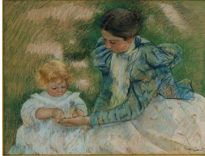
Şekil 10. Mother Playing with Child, (Çocuğuyla oynayan Anne), Mary Cassatt, karton üzerine monte edilmiş dokuma kağıt üzerine pastel, 64.8 x 80 cm, 1897, The Metropolitan Museum of Art (https://www.metmuseum.org/art/collection/search/10404).

Anne sağda ve çimenler üzerinde oturur bir şekilde beyaz elbisesi, tül yeleği ve topuz saçlarıyla dönemin tipik bir kadın portresini yansıtmaktadır. Anne sol elini yanı başında oturan kısa dalgalı, sarı saçlı ve beyaz tülenden uzun kollu elbisesiyle oturan çocuğuna uzatmıştır. Annenin avucunda Kuzey Amerika'ya özgü sarı çiçekli Frenk üzümü ( Ribes odoratum ) vardır. Aslında Cassatt'ın bu eseriyle kendi çocukluğunun geçtiği topraklara göndermede bulunduğu düşünülebilir.