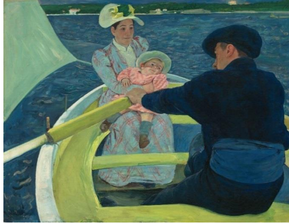
Şekil 5. The Boating Party, Mary Cassatt, Yağlıboya, 90 × 117.3 cm, 1893, National Gallery of Art, Chester Dale Collection, Washington, D.C. (www.britannica.com/biography/Mary-Cassatt)

Mary Cassatt, Viktorya Dönemi olarak isimlendirilen bir dönemde resimlerini yapmaya başlamıştı. Bu dönem ismini 1819'dan 1901'e kadar İngiltere'yi yöneten kraliçe Victoria'dan almıştır.