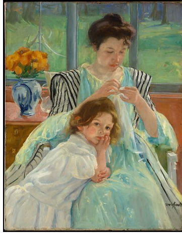
Şekil 2. Young Mother Sewing, Mary Cassatt, Yağlıboya, 92.4 x 73.7 cm, 1900, The Metropolitan Museum of Art ( www.metmuseum.org/art/collection/search/10425 ).

Resimlerinde kadınları genellikle evde veya evin bir bölümünde -örneğin bahçesinde- göstermiştir. Cassatt aslında kadınlarla çalışmayı seviyordu; onların sorumlulukları ve gündelik yaşantıları bir feminist olarak dikkatini çekiyordu. Mary Cassatt’ın resimlerinde kadınlar kimi zaman çay servisi ederken (Şekil 7), operadaki locasında öne doğru eğilip, gördüğü ve duyduğu her şeyin tadını çıkarırken (Şekil 9), çayda otururken (Şekil 7), gazetesini okurken (Şekil 8), goblen çerçevesini dikerken veya çalışırken (Şekil 2), bahçede sohbet ederken (Şekil 10) ya da bunun gibi gündelik yaşam içinde sıradan işlerle uğraşırken betimlenmiştir (Stevenson ve Monro, 1948, s. 33). Her yaşta bu kadınlar kendi başlarına varlıklardır. Sanat ve edebiyattaki pek çok kadının yaptığı gibi, erkek sanatçı, erkek kahraman veya erkek alıcı uğruna orada mevcut değildir.