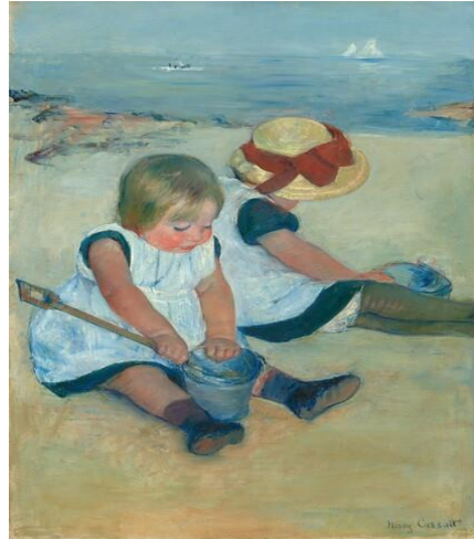
Şekil 4. Children Playing on the Beach, Mary Cassatt, Yağlıboya, 97.4 x 74.2 cm, 1884, National Gallery of Art, Ailsa Mellon Bruce Collection ( www.nga.gov/features/slideshows/mary-cassatt-selected-paintings.html#slide_5 ).

Elli görkemli görüntü, Japon tahta bloklarına olan erken ilgiden modernist teknikleri keşfetmesine kadar Cassatt'ın çalışmasının kapsamını oluşturdu. Cassatt öncü bir kadın sanatçı ve İzlenimci resmin Amerikan yüzü olarak adlandırılmıştır. Eserlerinin bazıları tanınmış olup; bir kısmı özel koleksiyonlar için yapılmış ve nadiren çoğaltılmıştır. Fransız İzlenimciliği ve Post-Empresyonizm'in önemini yeniden vurgulamıştır. Cassatt, Fransız ve Amerikan sanatının erkek egemen dünyalarında kadın varlığını ve içinde yaşadığı, çalıştığı farklı dünyaları uzlaştırma yeteneğini gösteren ilginç bir ressamdır.