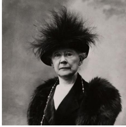
Şekil 1. Mary Cassatt, 1914, Archives of American Art, Smithsonian Institution ( www.si.edu/object/mary-cassatt:AAADCD_item_4001 ).

Mary Cassatt gördüklerini ve ışığı, diğer İzlenimciler arasında alışılmış olduğu gibi resimlemiştir. “İzlenimci” terimini kullanmayı bırakmış ve hayatının sonuna kadar meslektaşlarına ve kendisine “Bağımsızlar” demiştir. Bununla birlikte, İzlenimci yaklaşıma sadakati ve psikolojik durumları ile ışığın durumunu yansıtmayı sağlayan duyarlılığı, anneleri ve çocukları benzersiz bir şekilde aktarmasını sağladı.