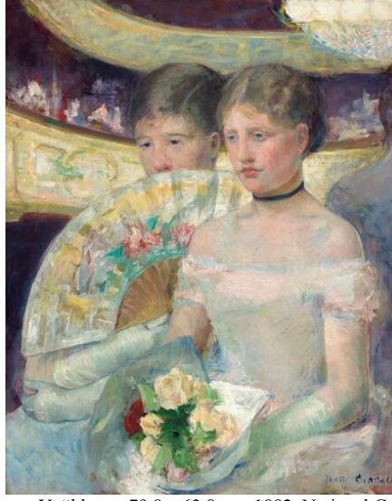
Şekil 9. The Loge, Mary Cassatt, Yağlıboya, 79.8 x 63.8 cm, 1882, National Gallery of Art, Washington, D.C (www.nga.gov/features/slideshows/mary-cassatt-selected-paintings.html#slide_4).

Mary Cassatt'ın İzlenimci etkiyi yansıttığı “Çocuğuyla Oynayan Anne” (Şekil 10) eserini incelediğimizde figürlerin giysilerinden mevsimin sonbahar, ilkbahar ya da yaz olduğu sonucuna varabiliriz. Tam olarak günün hangi zamanı olduğunu söylemek ise zordur; ancak öğleden sonra olma ihtimali kuvvetlidir. Ressamın bizi güneşin doğayı aydınlattığı ve çimenler üzerinde gezindiği bir arka plandan, bu sade betimlemede ön düzlemdeki iki figüre yönelttiğini görürüz. Çimenler üzerinde birbirlerine odaklanmış, sıradan bir günde, sıradan bir an içinde var olan bir anne ve çocuğu bulunmaktadır.