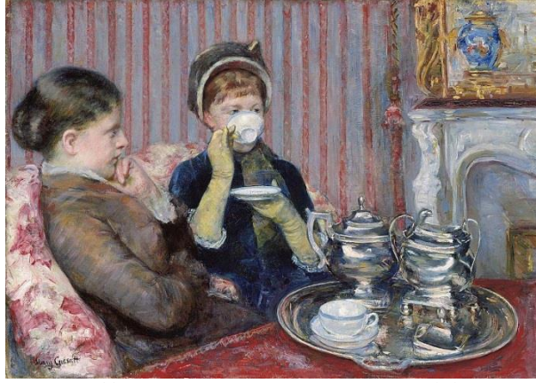
Şekil 7. Five O'Clock Tea, Mary Cassatt, Yağlıboya, 64.77 x 92.07 cm, 1880, Museum Of Fine Arts, Boston ( www.artsy.net/article/artsy-editorial-mary-cassatt-painted-domestic-life-way-male-impressionists ).