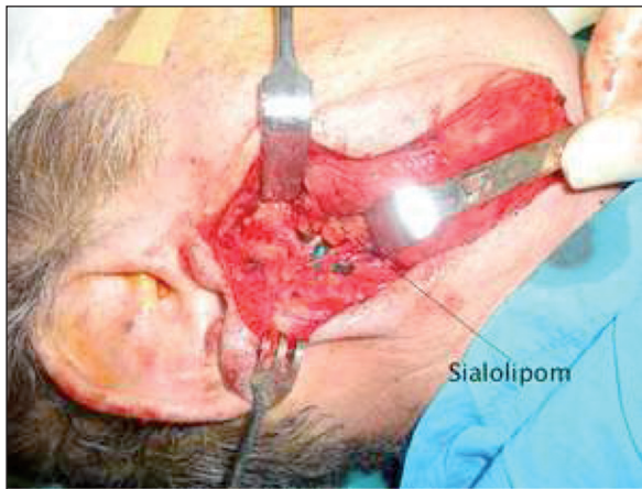
RESİM 1: İntraoperatif fasial sinir diseksiyonu ve kitlenin görünümü.

Postoperatif dönemde hastanın fasial sinir fonksiyonlarının normal olduğu görüldü. Hasta 2 yıl boyunca 3 aylık aralıklarla takip edildi ve herhangi bir komplikasyon ve nüks izlenmedi (Resim 4).