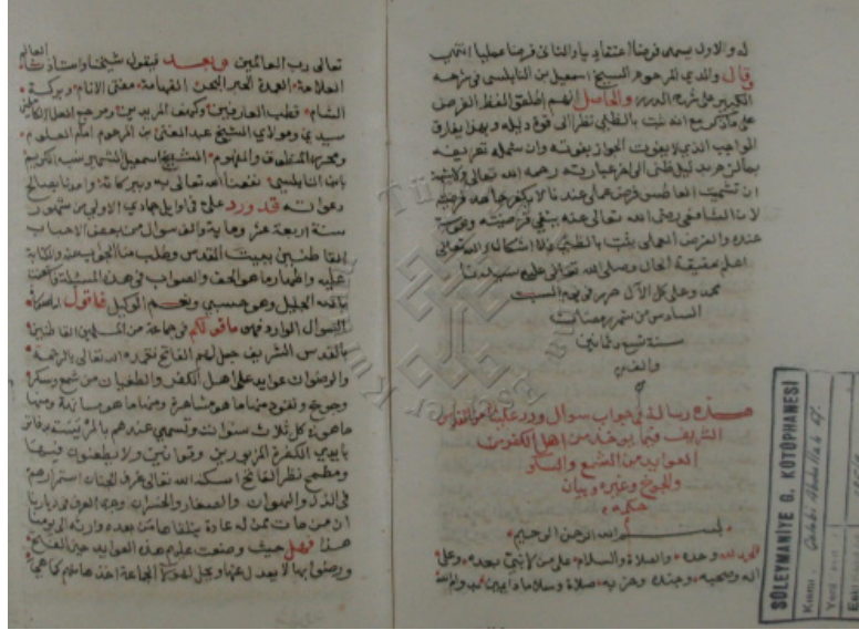
Süleymaniye Kütüphanesi Çelebi Abdullah 385