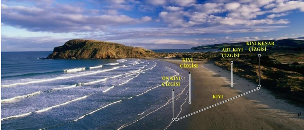
Resim 1. Ön Kıyı Çizgisi, Kıyı Çizgisi, Kıyı, Art Kıyı Çizgisi ve Kıyı Kenar Çizgisi**

Kaynak: Kıyı, http://sozluk.e-derslerim.com/index.php?harf=K&kelime=K%C4%B1y%C4%B1 , Erişim Tarihi: 12.05.2017.