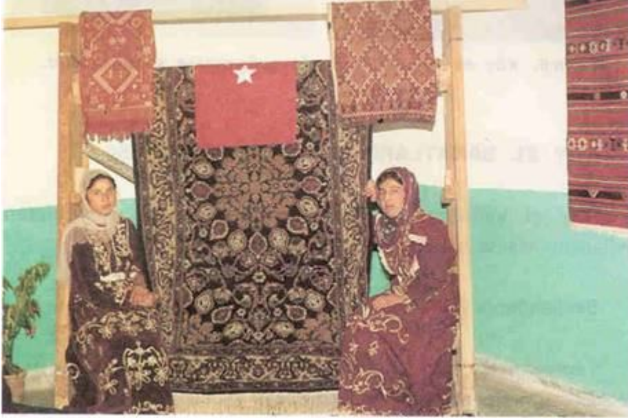
Resim 3. Halı dokumacılığı köy el sanatlarının çok önemli bir koludur.