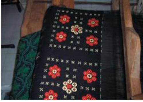
Resim 5. Karacakılavuz dokuma motifi

Yörede yapılan dokumalar yer minderi veya yastık olarak üretilmekte. Yer minderi olarak dokunanların ölçüsü eni standart olarak 65 cm boyu ise 100 / 110 / ve 130 cm olarak değişiklik göstermektedir. Yastık olarak dokunanlarının eni 60 boyu ise 110 cm dir. Karacakılavuz dokumaların atkı, çözgü ve desenlendirmesinde geçmişte kendi ürettikleri yün ipliği kullanılmakta iken şu anda dışarıdan temin edilen fabrikasyon yün, pamuk ve sentetik iplikler kullanılmaktadır (Anonim 2010a).