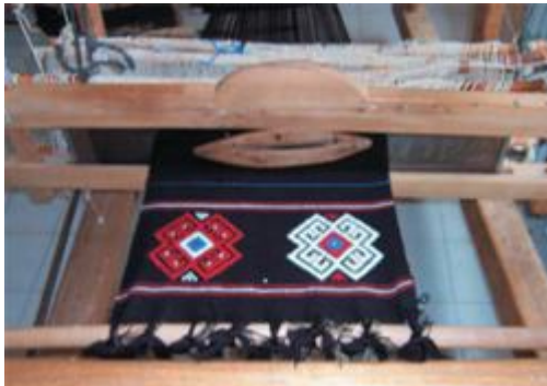
Resim 4. Karacakılavuz dokumaları

Yapılan dokumaların zemininde kullanılan, yörede şayak örgü olarak isimlendirilen dimi dokumalar 4 çerçeve ve dört ayaklı ahşap dokuma tezgâhlarında dokunmaktadır. Dimi dokumalar yüzeyinde bulunan atkı ve çözgü ipliklerinin yoğunluğuna göre atkı dimisi, çözgü dimisi ve çift yüzlü veya iki taraflı dimi olmak üzere 3 şekilde gruplandırılır. Karacakılavuz dokumalarında uygulanan çeşidi dokumanın her iki yüzeyinde de aynı görüntüye sahip ikiyüzlü dimidir (Anonim 2010a).