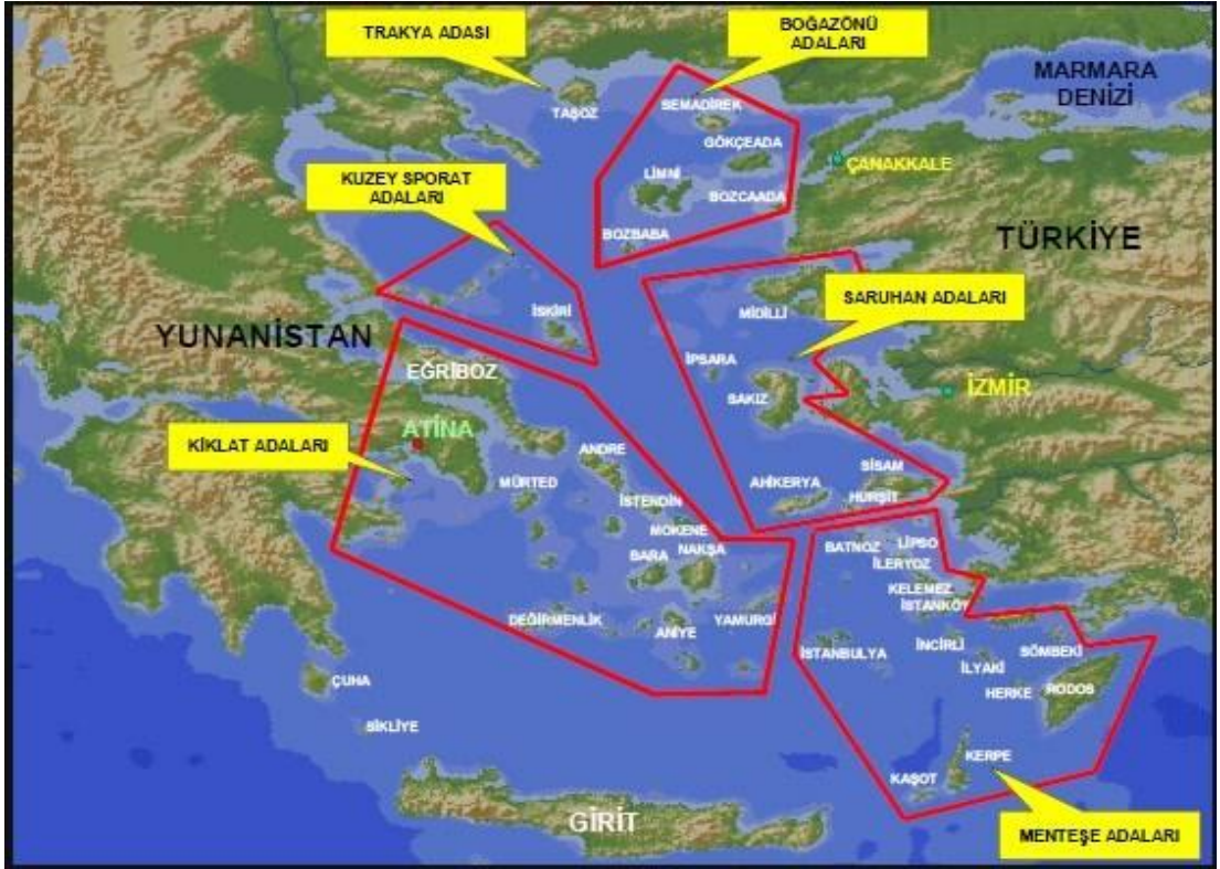
Şekil 4. Ege Denizi Ada Grupları

3 Şubat 1830'da Yunanistan'ı bağımsız bir devlet olarak ilân eden Londra protokolü uyarınca, “Kuzey Sporad ve Kiklat adaları ile Eğriboz adası Yunanistan'a verildi. Buna karşılık 39° kuzey enlemi ile 26° doğu boylamının doğusunda kalan bütün adalar Osmanlı egemenliğinde bırakıldı” 65 Böylece ilk kez Türklerden Yunanlara adalarda egemenlik devri gerçekleşmiş oldu. Bu ada grubunun egemenlik devri ve yetkisi konusunda taraflar arasında ne hukuki ne siyasi anlaşmazlık vardır.