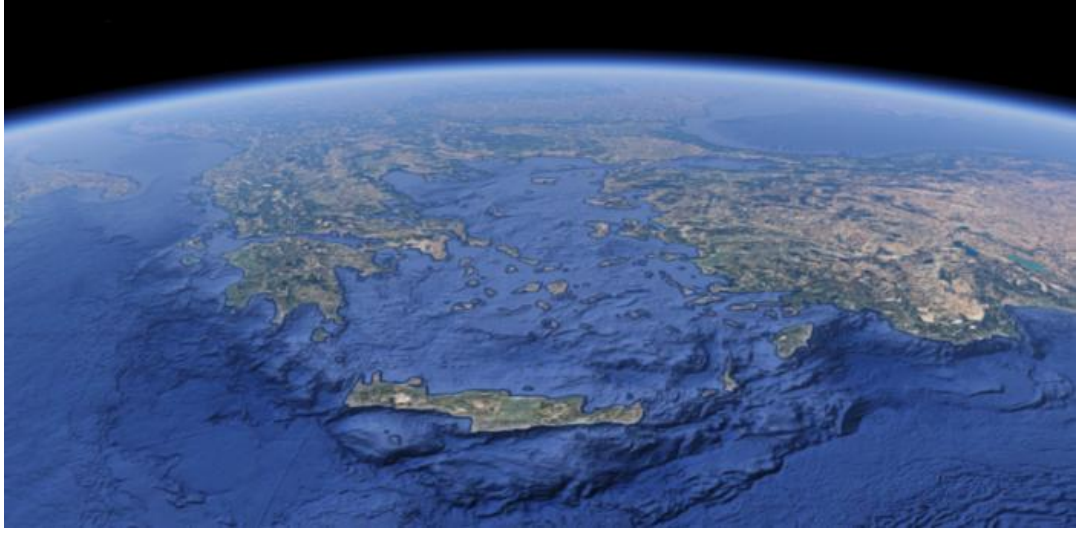
Şekil 2. Ege Denizi'nin Sınırlarının Uydu Çekimi Görüntüsü

yakınken, bir kısmı Ege Denizi'nin güneyinde kümelenmiş, bir kısmı da Batı Anadolu'nun kıyılarının yakınında kuzeyden güneye bir zincir meydana getirecek biçimde sıralanmıştır. 54