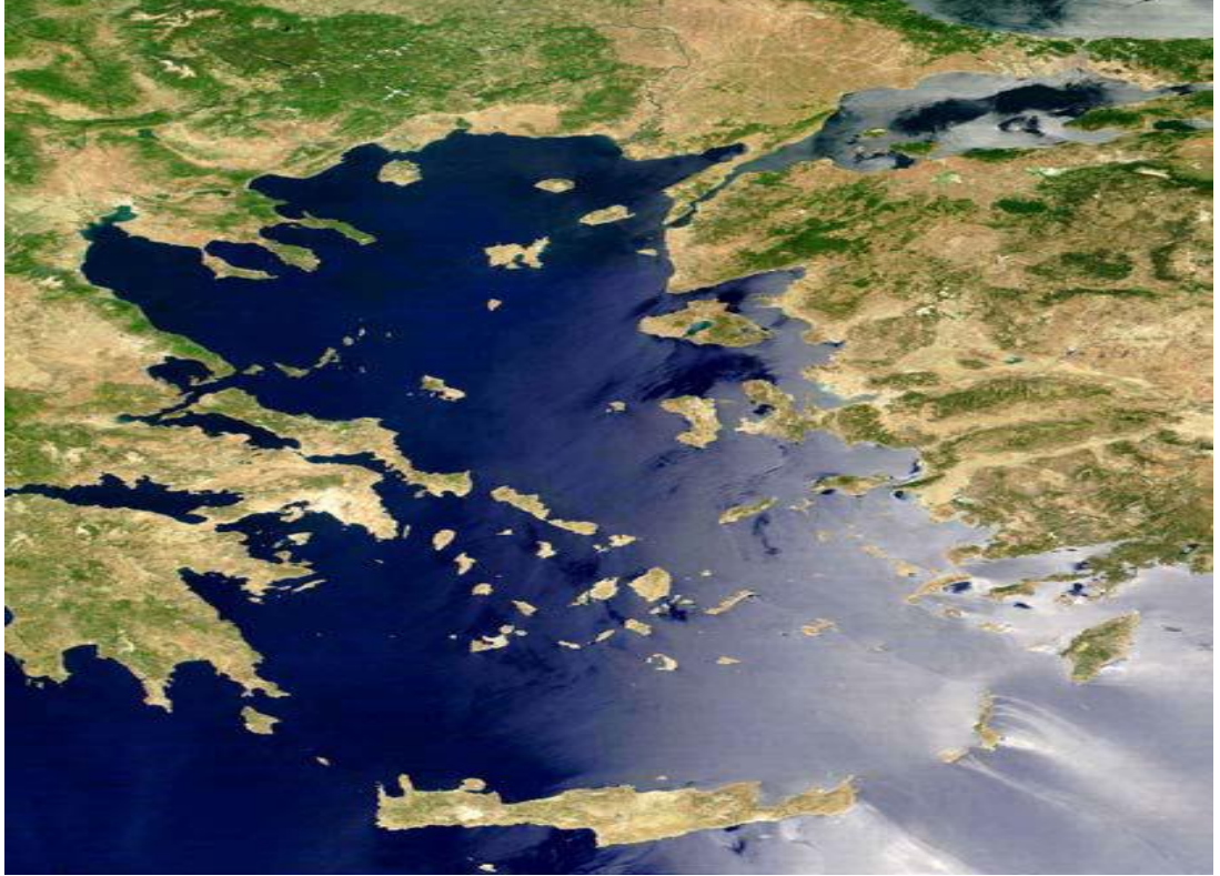
Şekil 3. Ege Denizi Ada, Adacık, Kayalıklarının Dağılımı

Ege Denizi'ndeki adaların genel coğrafi konumları, jeopolitik ve stratejik önemleri, egemenlik devirlerinin tarihsel boyutları ve Ege Denizi'nin statüsünü tayin eden uluslararası antlaşmaların düzenleniş biçimleri dikkate alındığında beş gruba ayırmak mümkündür. 63 Bunlar, Trakya/Boğazönü Adaları, Saruhan Adaları, Menteşe Adaları, Kuzey Sporad Adaları, Kiklat Adaları'dır. 64