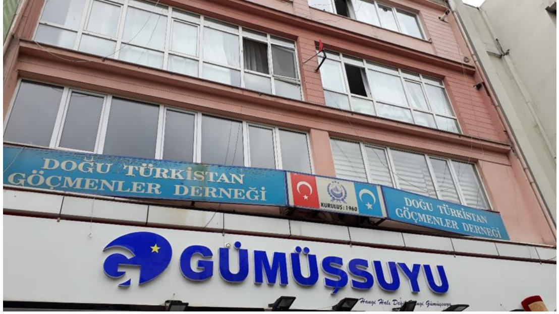
Fotoğraf 76 : İstanbul Zeytinburnu'nda bulunan Doğu Türkistan Göçmenler Derneği Binası