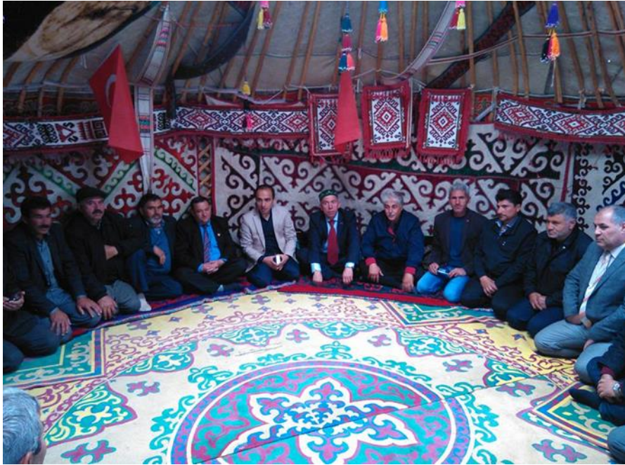
Fotoğraf 11: Daha sonra yapılan orijinal Kiygiz Üy'ün içinden görüntü 142