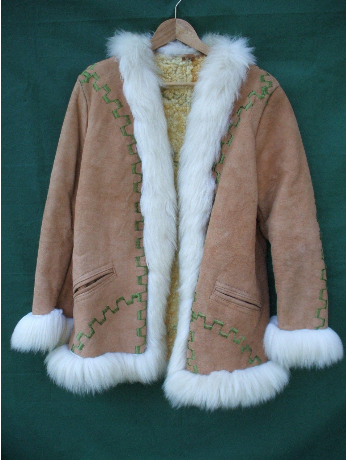
Ek 5: Afgan Ceket 271