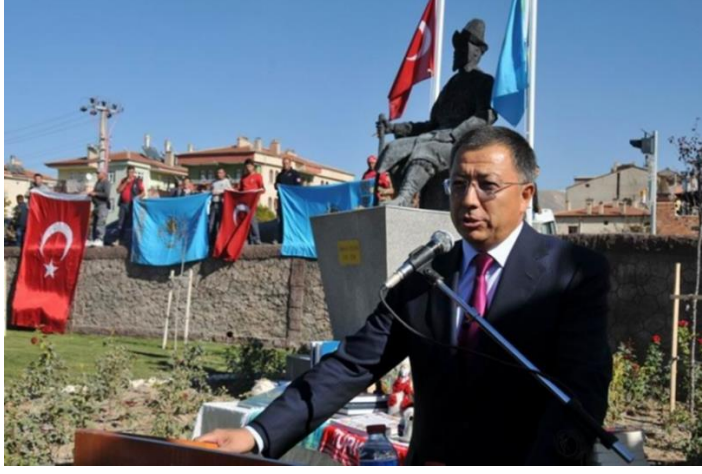
Fotoğraf 8: Abılay Han parkının açılışında Kazakstan Büyükelçisi Canseyit Tüymebayev konuşma yaparken.Hemen arkasında Abılay Han heykeli görülüyor. 140