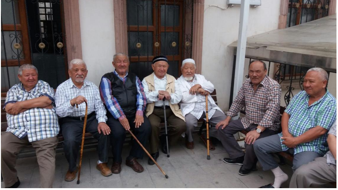
Ek 4: Kazakkent Altay Camii bahçesinde Aksallar namazı beklerken.