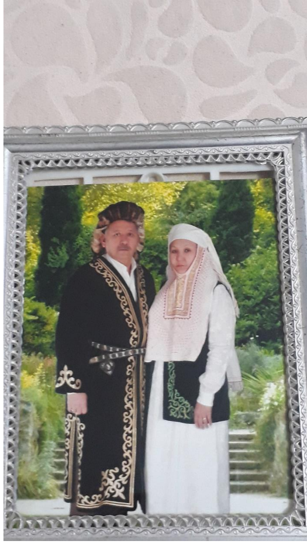
Ek 3: Geleneksel Kazak kıyafetleriyle bir Kazak çifti