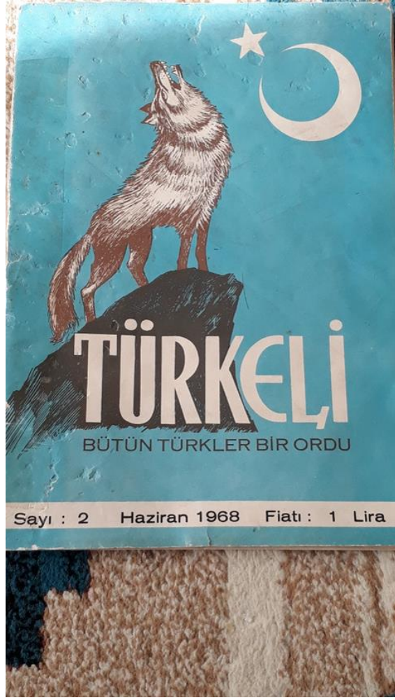
Fotoğraf 16 : Hasan Oraltay'ın yayınladığı Türkeli dergisinin kapağı