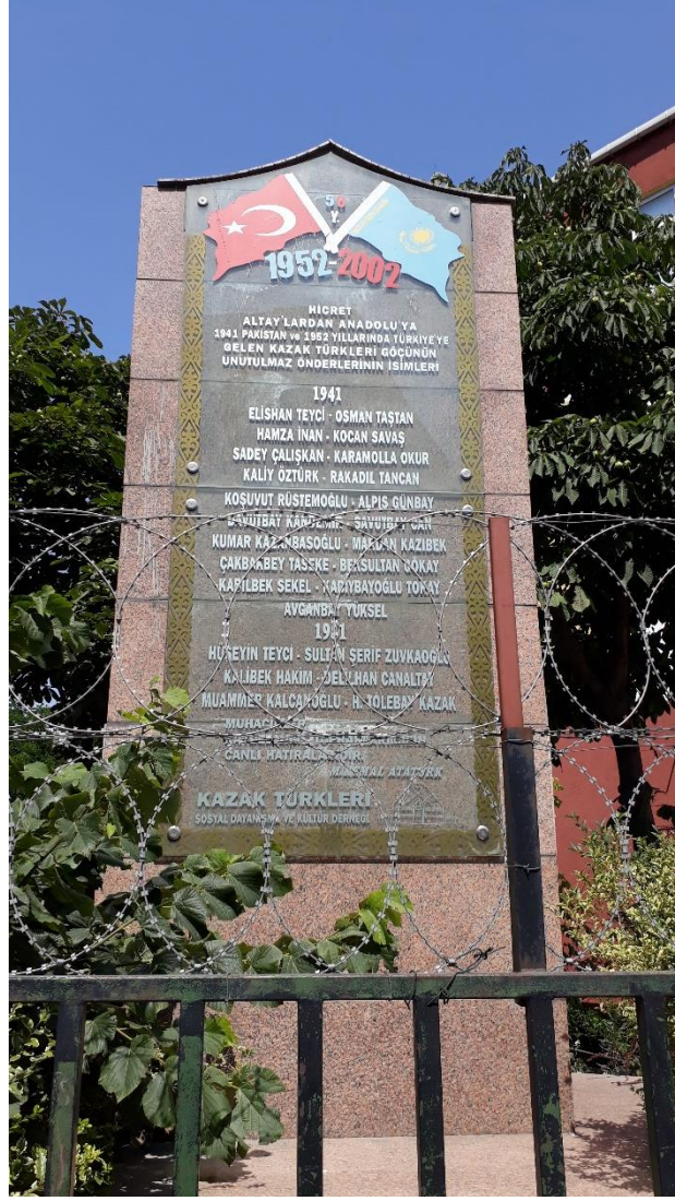
Ek 2: Kazakların Türkiye'ye gelişinin 50. Yılı anısına dikilen anıt (Kazakent)