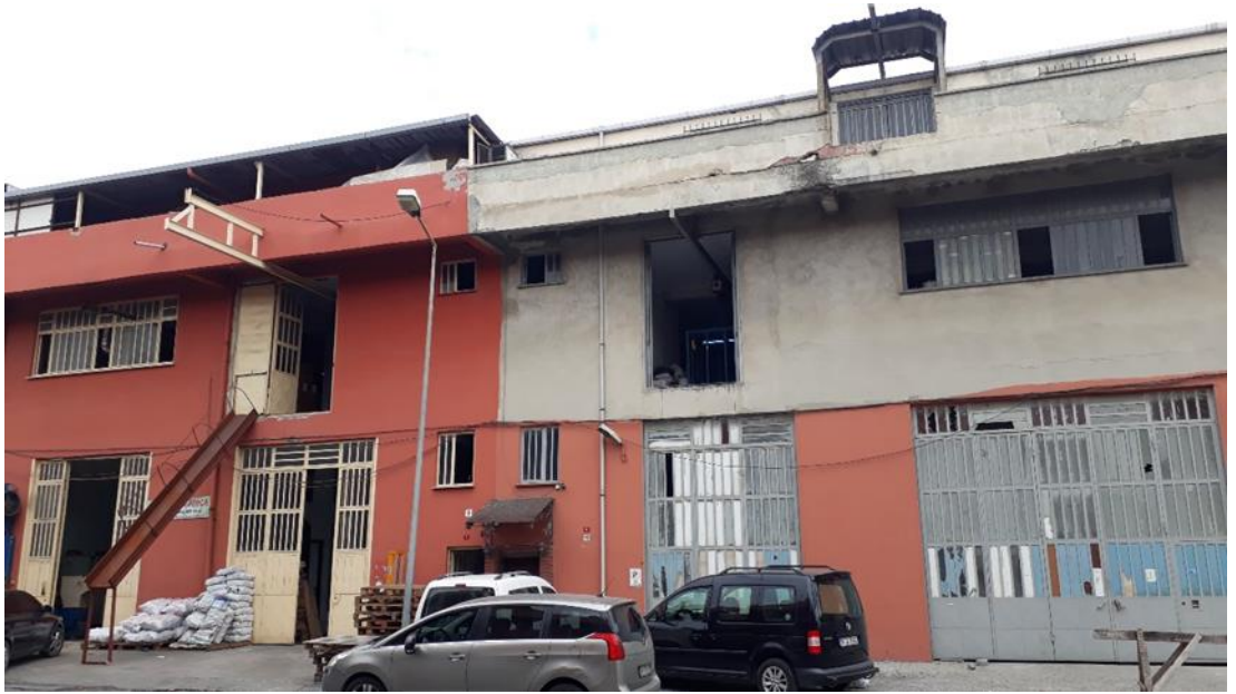
Fotoğraf 71 : Bir zamanlar Türkistanlılar Yer Muşambası'nın üretim yaptığı yer. Doreks, şu anda sağdaki boyasız kısımda üretim yapıyor.