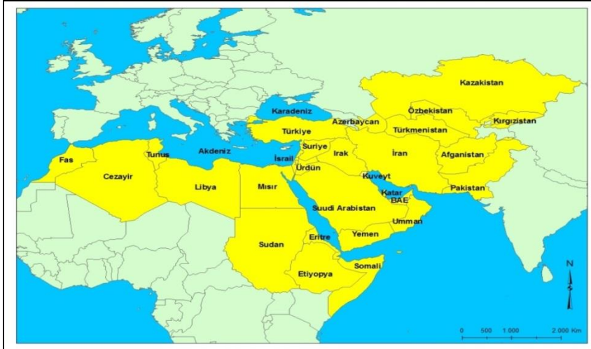
Şekil 1. En geniş anlamda Orta Doğu coğrafyası.

Asya, Avrupa ve Afrika'nın birbirlerine en çok yaklaştığı yerde bulunan Orta Doğu, en geniş anlamda batıda Fas, Tunus, Cezayir, Libya, Somali, Etiyopya, Sudan ve Mısır'dan başlayarak doğuda Umman Körfezi'ne kadar uzanan ve Irak, Kuveyt, Bahreyn, Katar, BAE, Umman'ı içine alan, kuzeyde Türkiye, Kafkasya ve Orta Asya Türk Cumhuriyetlerini kapsayan, ayrıca İran, Afganistan ve Pakistan'ın da dâhil edildiği, güneyde ise Suudi Arabistan'dan Yemen'e uzanan Arap yarımadasını çevreleyen ve ortada Suriye, Lübnan, Ürdün, İsrail ve Filistin'in yer aldığı bir coğrafya olarak tanımlanabilir (Şekil 1) (Arı, 2004, s. 25).