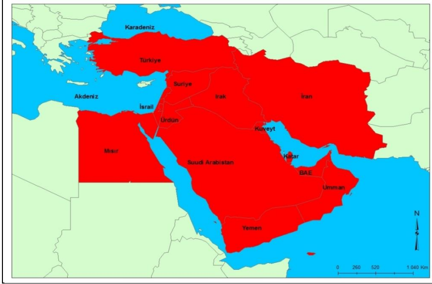
Şekil 2. Dar anlamda Orta Doğu coğrafyası.

Pakistan ise Güney Asya ya da Güney Batı Asya Coğrafyası içinde düşünülmektedir (Arı, 2004, s. 25).