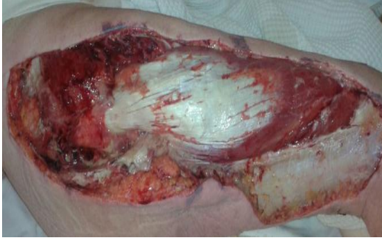
Resim 1. Debridman sonrası NF bölgesinin görünümü