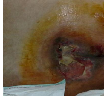
Resim 2. Sakral bölgede gelişen basınç yarası