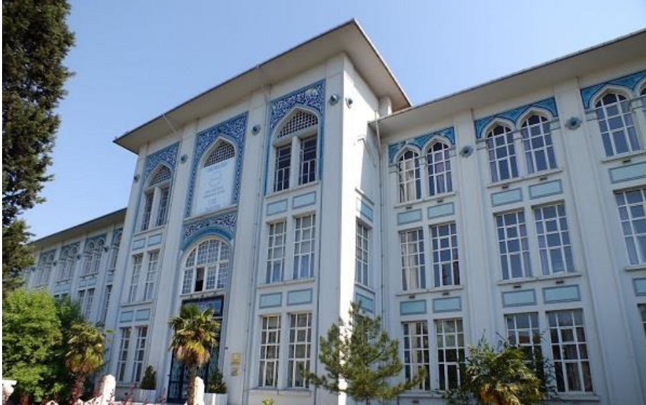
Resim 1: Çapa Öğretmen Okulu (Çapa Fen Lisesi, 2019)

1874 yılında Darümuallimîn-i idadi açılırken, 1890 yılında ise okul, Sıbyan (ilk), Rüşdiye (Orta), İdadi (Lise) ve Âli (Yüksek) kısımlarına ayrılmıştır. Âli kısım ise Fen ve Edebiyat bölümlerine ayrılan bu dört kademeli okulun adı Darümuallimîn-i Âli (1891) olarak yeniden tanzim edilmiştir. Bu tarih aynı zamanda liselere öğretmen yetiştiren Yüksek Öğretmen Okulları'nın kuruluş tarihi olarak kabul edilmektedir. Ayrıca Darümuallimîn bünyesinde sıbyan, idadi ve sultani kısımları açılmıştır. Sıbyan ve Rüşdiyeler ilk kademede, idadi ve sultaniler ikinci kademede yer almıştır (Çapa Fen Lisesi, 2019). 1868'de Dârümuallimîn-i Sıbyân adı altında iki yıllık bir öğretmen okulu daha açılmıştır. Yeni açılan bu okulda eskiden beri okutulmakta olan Kur'ân-ı Kerîm, elifbâ, ilmihal ve tecvid gibi dini derslerin yanı sıra coğrafyaya giriş, hesap, ahlâk ve usûl-i tadrîs gibi öğretim metodu derslerine de yer verilmiştir (Öztürk, 1993). Ayrıca 1870'de Kız Öğretmen Okulu (Dârü'l-muallimat) açılmıştır (Ergün, 1987).