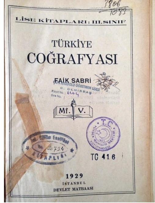
Resim.3 1929 tarihli Türkiye Coğrafyası ders kitabının kapak sayfası. Kapakta görüldüğü üzere dört farklı döneme ait mühürler ve demirbaş numaraları yer almaktadır.

Cumhuriyet dönemi ile beraber okulun isminin değişmesinin yanında kütüphanesindeki kitap sayısı da değişmiştir. 1925 yılında tarih, coğrafya, seyahatnameler başlığı altındaki kitap sayısı sadece 107 iken bu sayı 1968'de 5083 gibi yüksek bir rakama ulaşmıştır (Becerikli, 2019). Dolayısıyla okulun kütüphanesinin coğrafya açısından zengin olduğu söylenebilir.