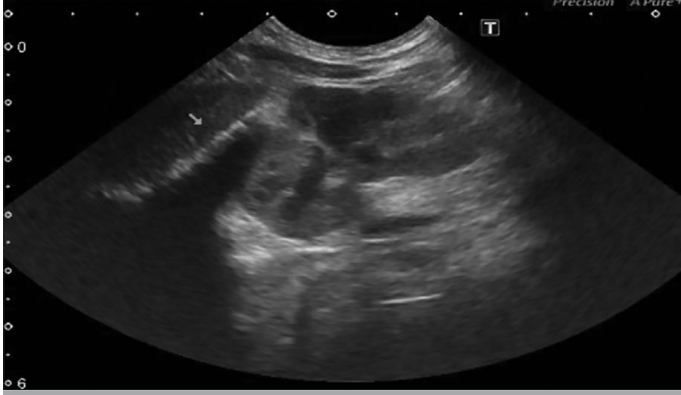
Resim 1. Hastaya ait batin ultrasonografi görüntüsü: hepatosplenomegali ve bilateral sürrenal kalsifikasyonu