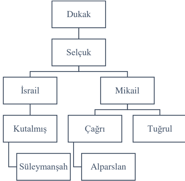
Grafik 1: Alparslan ve Süleymanşah'ın Şeceresi

İbn Hallikân'ın burada yanlışlaması gerekmektedir. Nitekim Tuğrul Bey biyografisinde; Ebu Talib Muhammed b. Mikail b. Selçuk b. Dukak; Alparslan biyografisinde; Ebu Şuca' Muhammed b. Çağrı Bey Davud b. Mikail b. Selçuk b. Dukak