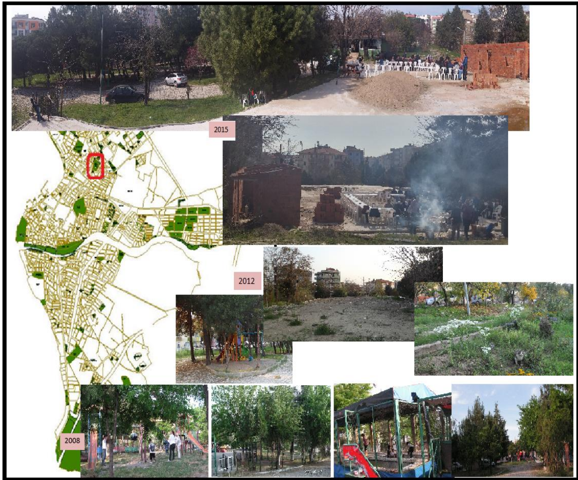
Şekil 4. 500. Yıl Parkı'nın 2008, 2012, 2015 yılları görüntüleri

Alandaki yer döşemeleri Arnavut kaldırımı taşlarından olup, alana nostaljik ve doğal bir görünüm kazandırsa da uzun yıllar bakımları yapılmadığından yürüyüş için sağlıklı değildir. Alanda yer alan anfi tiyatro yaz aylarında bazı konserler için kullanılmakla birlikte oldukça küçüktür ve bakımsızdır.