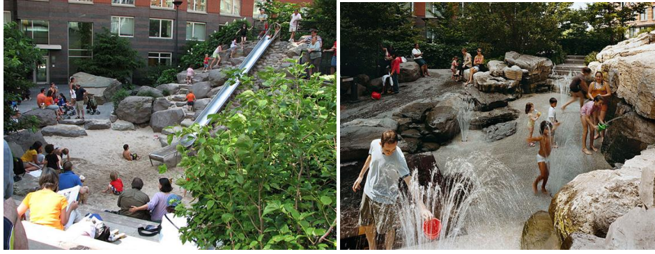
Şekil (Figure) 1. Teardrop Park, New York http://www.mvva.com/project.php?id=2 , (13.3.2015)