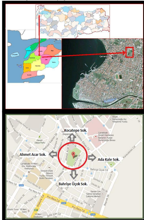
Şekil 2. Çanakkale, 500. Yıl Park alanının konumu (Google Earth (2013)'e göre)

mahallesinde yer almaktadır ve 22.000 m 2 alana sahiptir. Alan, kentin yerleşimi açısından en yoğun yapılaşma olan bölgedir. Ulaşım açısından avantajlı olup, tüm kentliye hitap etmektedir (Şekil 2).