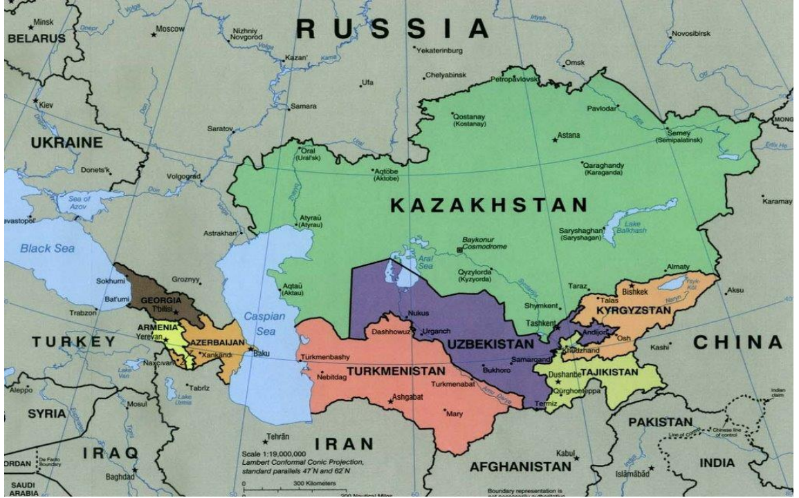
Şekil 1.1: Türkmenistan'ın Konumu