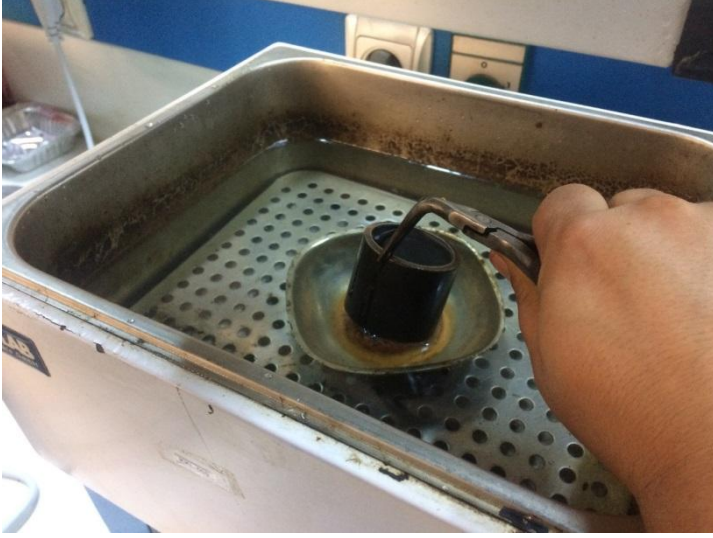
Şekil 3.13 Su banyolarına koyulması