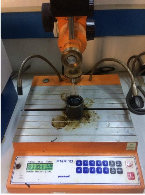
Şekil 3.15 Penetrasyon cihazında yapılan testte iğnenin batma ölçümü