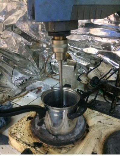
Şekil 3. 9 Geri dönüşüm yağının eritilmesi