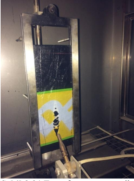
Şekil 3.21 E sınıfı yangın test cihazı