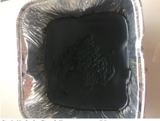
Şekil 3.2 Geri Dönüşüm Yağı