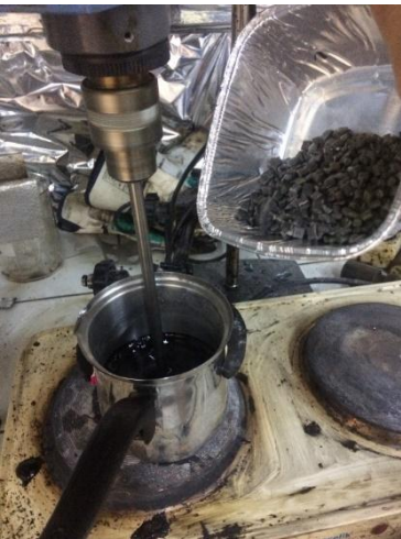
Şekil 3.10 Karışıma izotaktik polipropilen eklenmesi