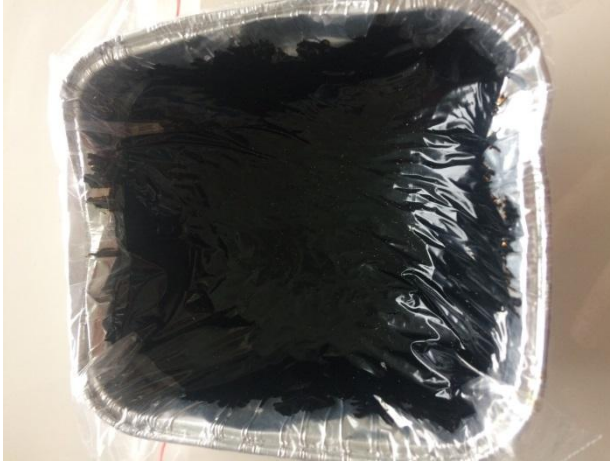
Şekil 3.1 Bitüm

Esnek bir yapıya sahip olduğu için zemine uygulandığında çatlakları absorbe etme özelliği vardır. Tamiri rahat ve kolaylıkla yapılabilen bir malzemedir (Anonim2017b).