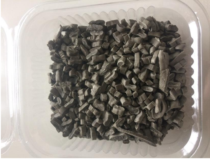
Şekil 3.4 Alçak yoğunluklu polietilen