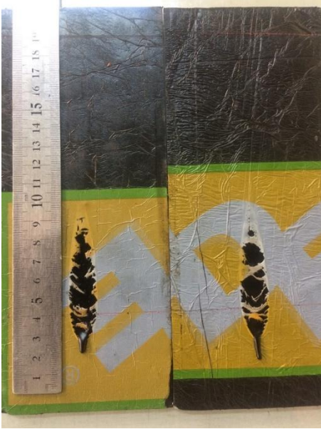
Şekil 3.22 İki numunenin karşılaştırılması