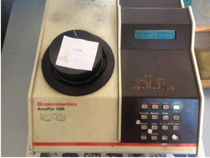
Şekil 3.19 Piknometre

Malzememizin yoğunluk testi piknometre ile yapıldı (Şekil 3.19). Numunemiz piknometrenin yuvasına yerleştirildikten (Şekil 3.20) sonra kapağını kapatılarak gerekli düğmeye basıp önce numune içindeki gazın boşalması sağlandı. Daha sonra yoğunluk testimiz tamamlandı piknometreden yoğunluk değerimiz okundu.