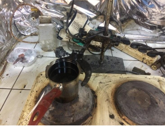
Şekil 3.8 Bitümün sıvı hale gelme işlemi