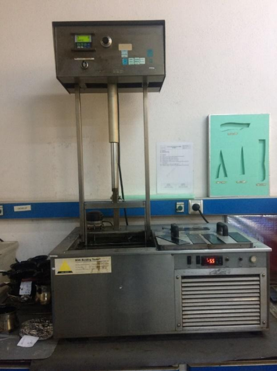
Şekil 3.18 Cold-Flex cihazında soğukta bükülme testi

13 cm x 5 cm ebatlarında dikdörtgen şeklinde ve 3 mm kalınlığında numunemizle Cold-Flex cihazında soğukta bükülme testi yapıldı (Şekil 3.18).