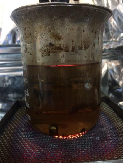
Şekil 3.17 Gliserin banyosu