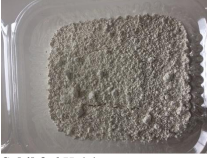
Şekil 3.6 Kalsit