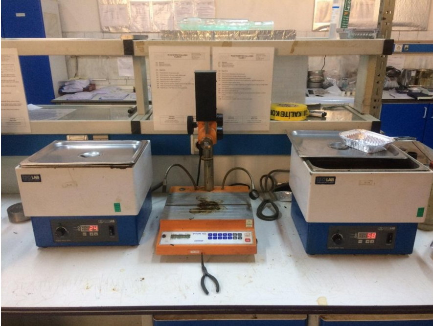
Şekil 3.14 Penetrasyon cihazı