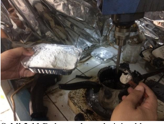
Şekil 3.11 Dolgu malzemelerinin eklenmesi

Erittiğimiz karışımı penetrasyon testi için silindir şeklindeki kalıplara diğer testler için ise çelik tepsiye döküp soğumaya beklettik.