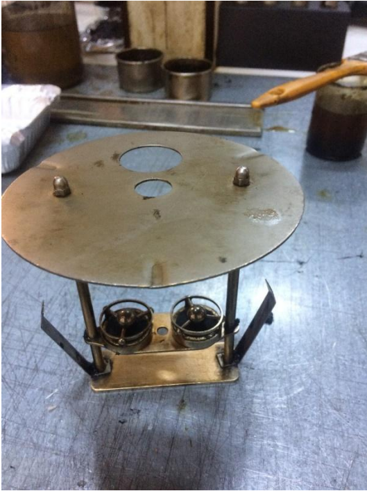
Şekil 3.16 Ring-ball düzeneği

Yumuşama derecesini ölçmek için 2 adet 3,5 gram ağırlığındaki bilyalarla Ring-ball düzeneği kuruldu (Şekil 3.16). Gliserin banyosunda ısıtma amaçlı deneye tabi tutuldu. Bilyalar düştüğü andaki sıcaklığı not edip kaç derecede yumuşadığını kaydedildi (Şekil 3.17).