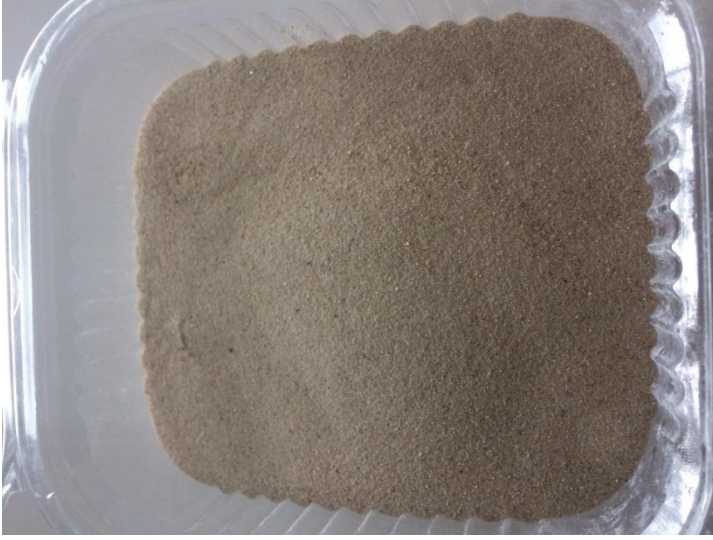
Şekil 3.7 Silis kumu