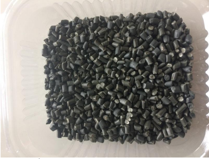
Şekil 3.3 İzotaktik Polipropilen

Polipropilen kristalleri için erime noktası yaklaşık 160 °C'dir ve genellikle 200 °C üzerinde proses edilir (Anonim2017d).