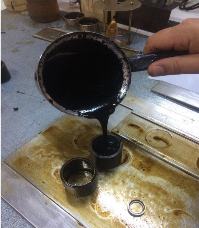
Şekil 3.12 Penetrasyon testi için malzemenin silindir kalıplara dökülmesi

Penetrasyon testini 25 °C ve 60 °C sıcaklıklarında iki farklı şekilde yapıldı. Hazırlanmış olan malzeme 4 cm çap ve 4 cm yüksekliğindeki silindir kalıplara döküldü (Şekil 3.12). 15 dakika soğuması bekletildikten sonra su banyolarına koyuldu (Şekil 3.13). 35 – 40 dakika sıcaklık sabitlenene kadar bekletildi.