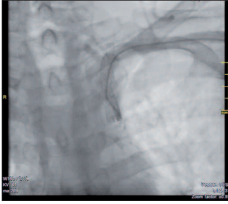
RESİM 2: Postoperatif anjiyografi görüntüsü.

talık hakkında şüphe uyandırabilir. Doppler ultrasonografi retrograd vertebral akımın tespitinde faydalı olabilir. Bu tespit edildiğinde ise brakiosefalik arterler ileri görüntüleme olarak manyetik rezonans veya BT anjiyografi ile stenoz açısından değerlendirilebilir. Bizim olgumuzda da ultrasonografi ile retrograd vertebral akım tespiti sonrası BT anjiyografi ile yapılan dökümantasyonda, proksimal sol subklavyan stenozu tespit ettik.