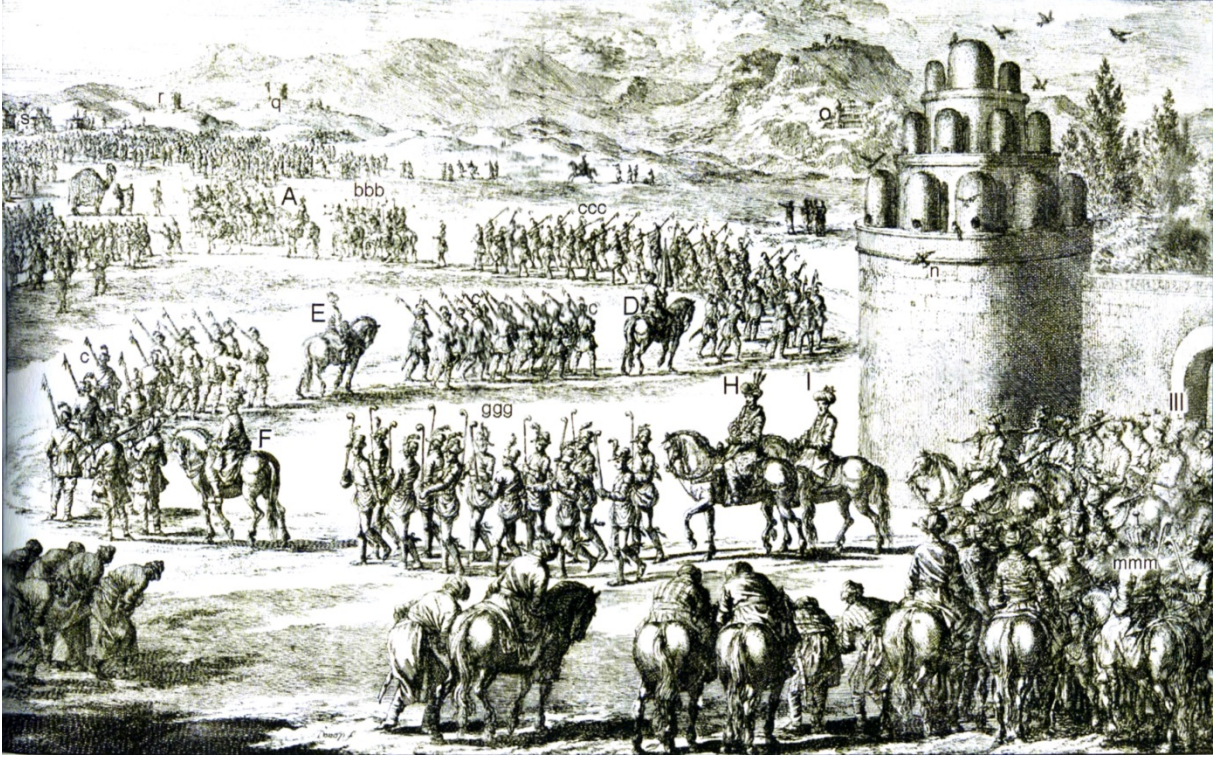
Resim 1: Kurban Merasimi (Keampfer 2018, 171)