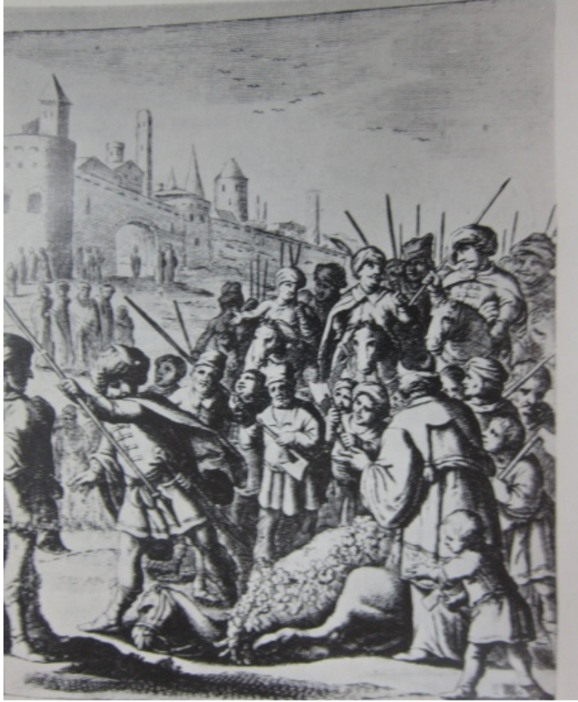
Resim 2: Kurban Merasimi (Pietro Della Valle 1348, 110).