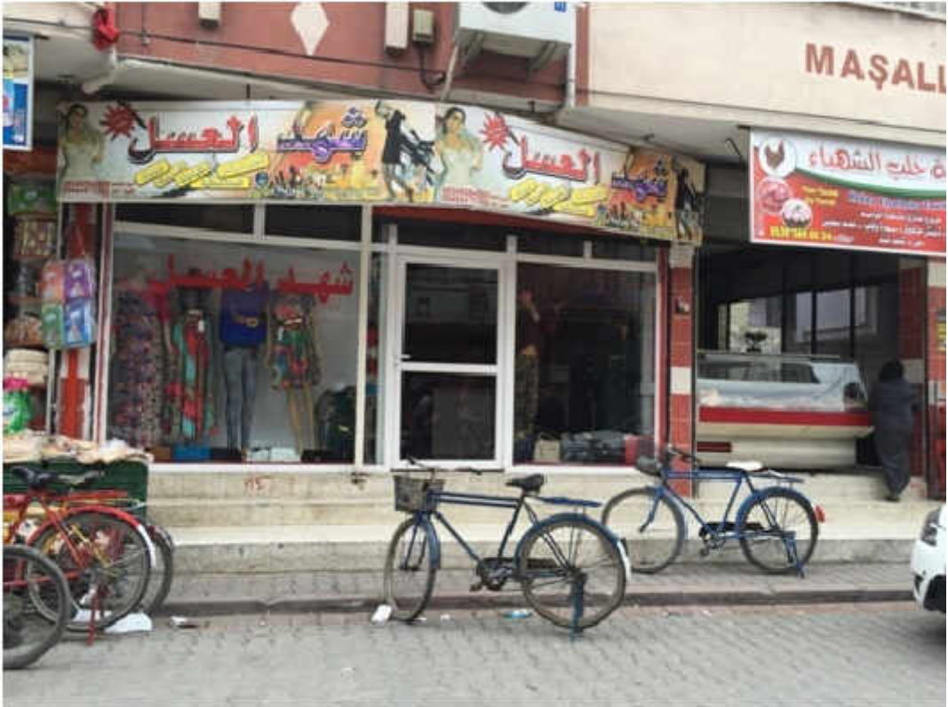
Fotoğraf 6: Adana'da Suriyeli kadın kıyafetleri satan bir giyim mağazası