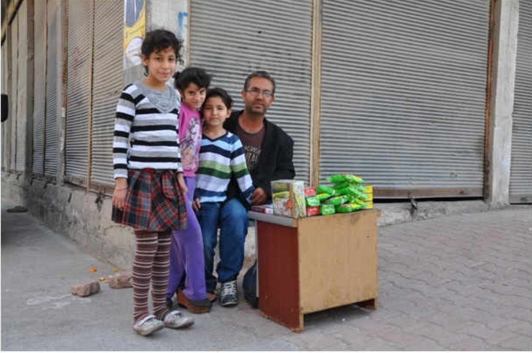
Fotoğraf 3: Suriye'ye ait mamulleri satan seyyar satıcı ve kızları