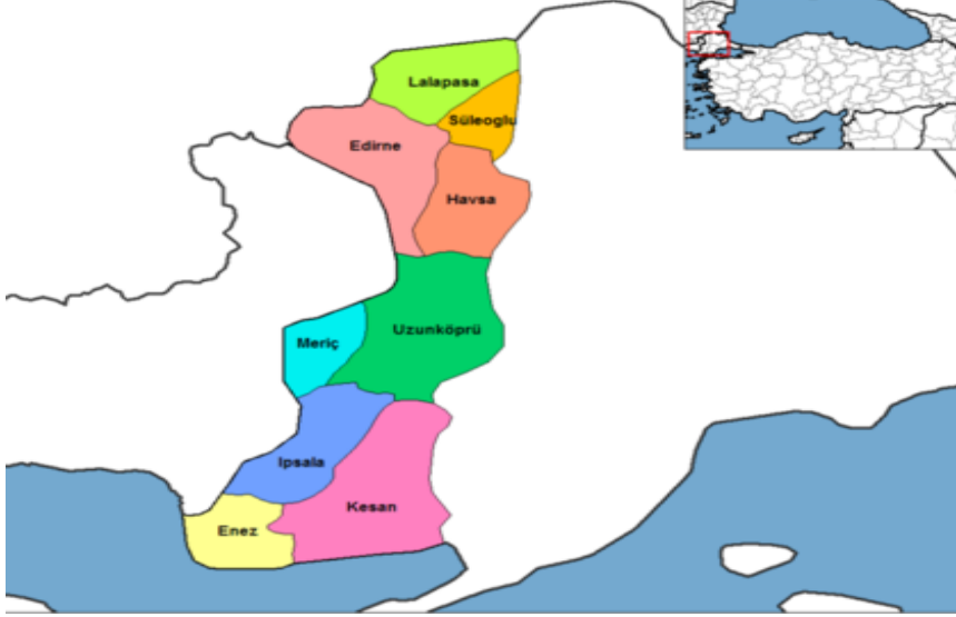
Şekil 1. 2. Lalapaşa'nın Coğrafi Konumu

İlçede 27 köy muhtarlığı ve 1 mahalle muhtarlığı bulunmaktadır. 27 köy: Büyünlü, Çallidere, Çatma, Çömlekakpınar, Çömlekköy, Demirköy, Doğanköy, Dombay, Hacıdanışment, Hacılar, Hamzabeyli, Hanlıyenice, Hüseyinpınar, Kalkansöğüt, Kavaklı, Küçünlü, Ortakçı, Saksagan, Sarıdanışment, Sinanköy, Süleymandanışment, Taşlımüsellim, Tuğlalık, Ömeroba, Uzunbayır, Vaysal, Yünlüce Köyleridir. Mahalle muhtarlığı ise Lalapaşa Merkez Muhtarlığıdır.