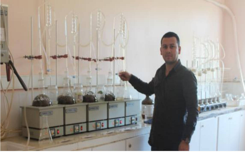
Şekil 3.14. Neoclevenger cihazında su buharı distilasyon yöntemi uygulaması

saf su ile cam balonlara doldurulmuştur. Cam balonlarda 3 saat kaynatılan örneklerden elde edilen uçucu yağlar volumetrik olarak ölçülüp kaydedilmiştir (Şekil 3.15).