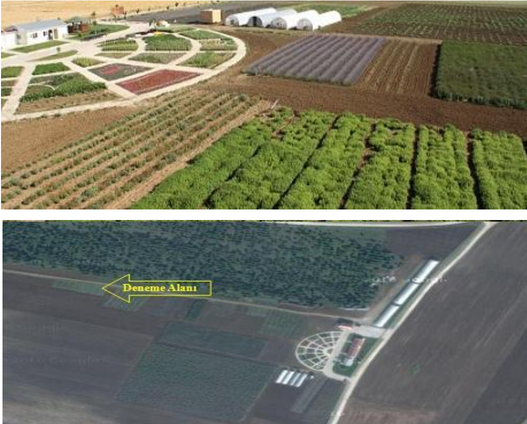
Şekil 3.1. Deneme alanı (TÜRAM Silivri 2016)

Araştırma alanının kurulduğu TÜRAM İstanbul Silivri ilçesi sınırlarında Gümüşyaka mahallesinde bulunmaktadır (Şekil 3.1). Gümüşyaka; Silivri Tekirdağ yolunun 17. km' sinde 41 derece 03 dakika kuzey paraleli ve 28 derece 2 dakika doğu meridyenlerinin kesiştiği noktada, İstanbul iline bağlı ve il merkezinin 79 km batısında, rakımı 45 m ve Marmara Denizi sahilinde yerleşim yeridir (Anonim 2016a). Batısında Tekirdağ iline bağlı Çorlu ve Marmara Ereğlisi ilçeleri, doğusunda İstanbul iline bağlı Büyükçekmece ilçesi, kuzeyinde İstanbul iline bağlı Çatalca ilçesi, kuzeybatıda Tekirdağ iline bağlı Çerkezköy ilçesi, güneyinde ise Marmara Denizi yer alır.