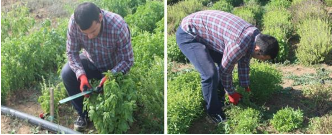
Şekil 3.13. Değerlerin ölçülmesi ve hasat