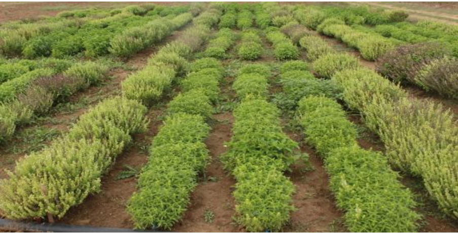
Şekil 3.12. 02.10.2015 tarihinde yapılan 3. biçim (biçimden önceki gün)