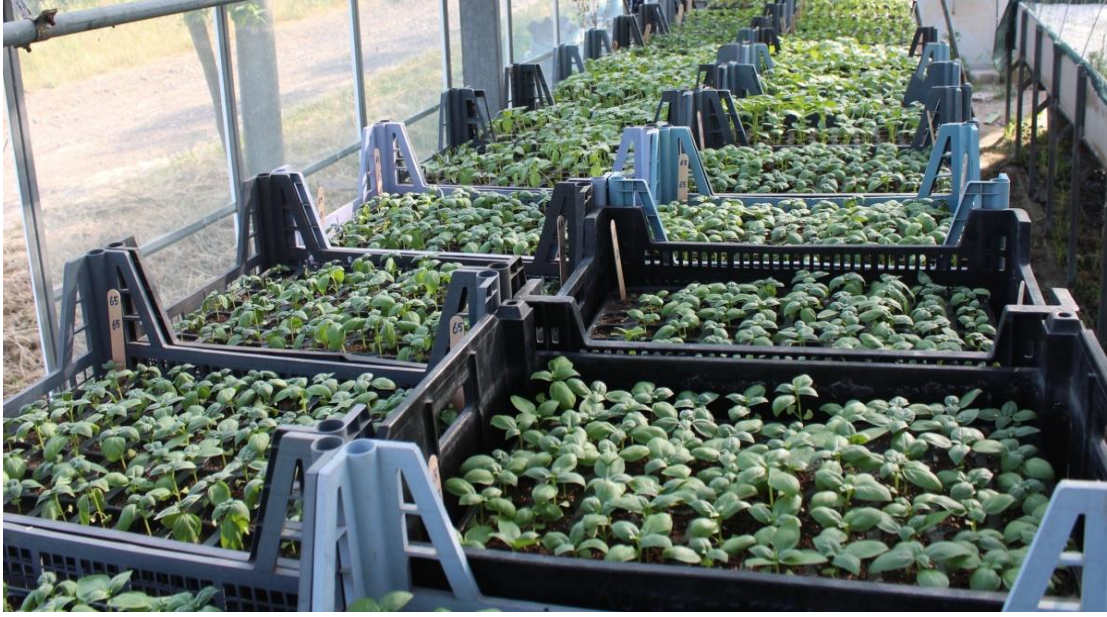
Şekil 3.5. Viyollerdeki fidelerden genel görünüm (25.05.2015)