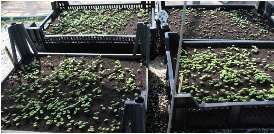
Şekil 3.3. Çimlenmiş fesleğin tohumlarının görünümü (07.05.2015)