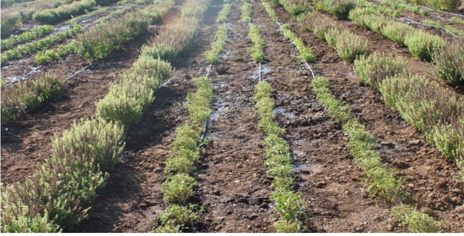
Şekil 3.11. 02.09.2015 tarihinde yapılan 2. biçim