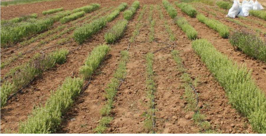
Şekil 3.10. 24.07.2015 tarihinde yapılan 1. Biçim

Hasat; her biçimde çiçeklenme başlangıcında yerden 10 cm yükseklikten ve kenar tesirler çıkarılarak yapılmıştır (şekil 3.10, şekil 3.11, şekil 3.12, şekil 3.13):