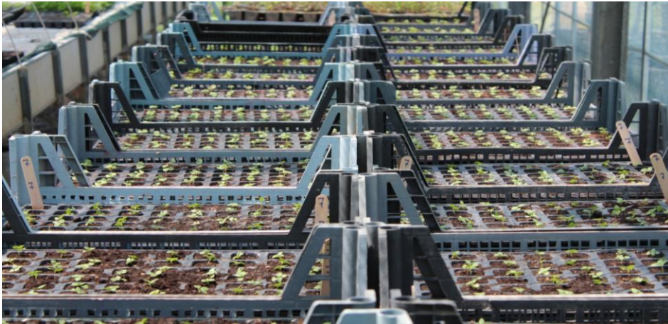
Şekil 3.4. Fidelerin viyollerdeki gelişimi (13.05.2015)

2-3 cm boya ulaşan fideler 13.05.2015 tarihinde; tarla toprağı, yanmış hayvan gübresi ve torf (1:1:1) dolu viyollere aktarılmıştır (Şekil 3.3 ve Şekil 3.4). Viyollere alınan fidelerin sulaması ve bakımı düzenli olarak yapılmıştır. Cam serada bulunan viyollerin gelişimi şekil 3.5’ te, fidelerin tarlaya şaşırtılmadan önceki son durumu ise şekil 3.6’ dan izlenebilmektedir.