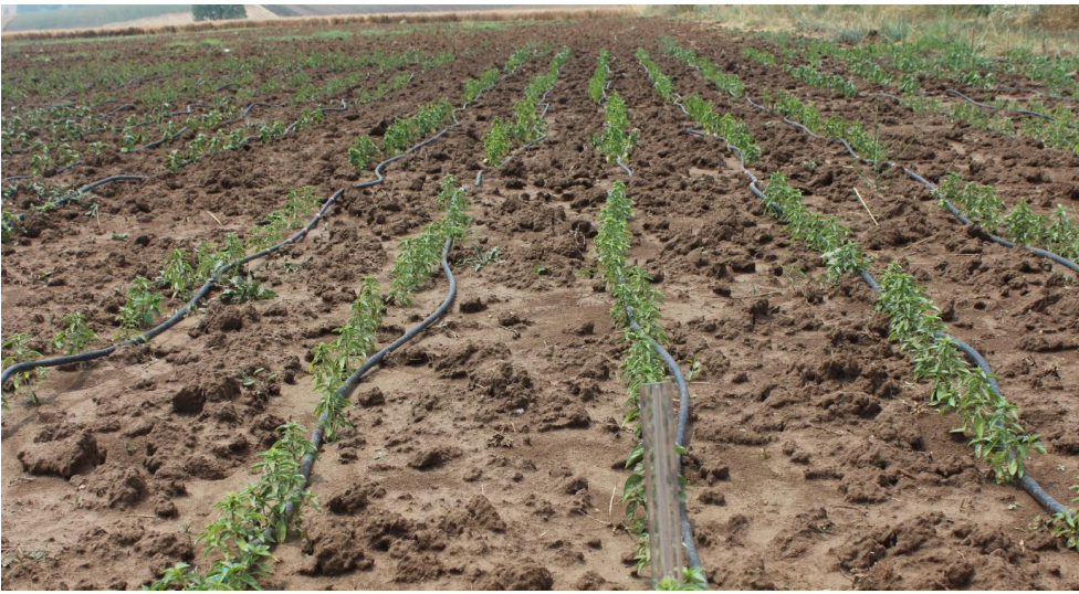
Şekil 3.8. Dikilen fidelerin tarladaki görünümü