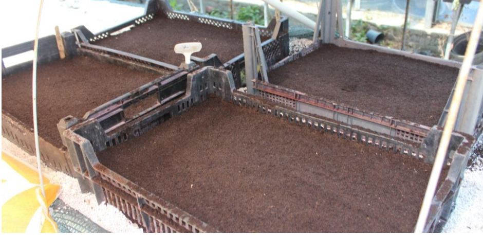
Şekil 3.2. Fesleğin tohumu ekilen kasaların görünümü (20.04.2015)