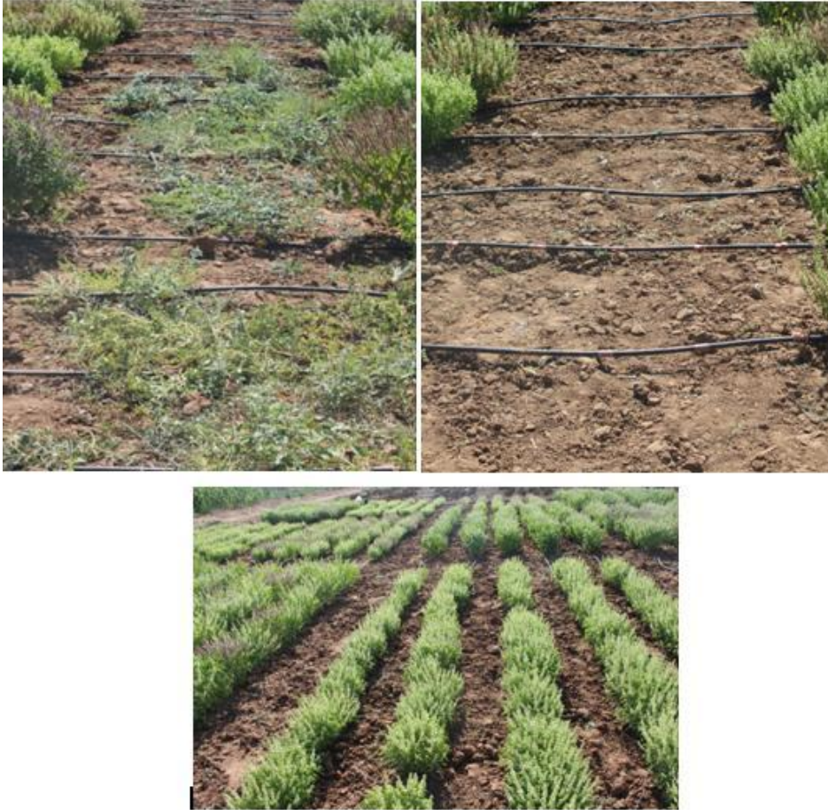
Şekil 3.9. Yabancı ot mücadelesinden görüntü

Fidelerde gelişim dönemi boyunca herhangi bir hastalık ve zararlıya rastlanmamıştır.