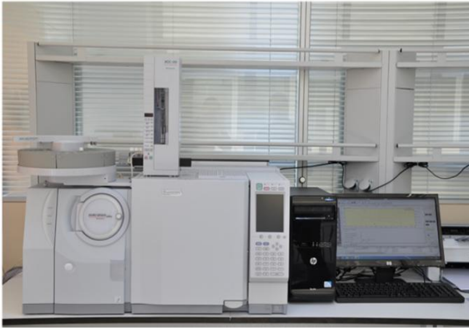
Şekil 3.16. Gaz kromatografisi kütle spektrometresi

Gaz Kromatografisinde karışımdaki maddeler birbirinden ayrıldıktan sonra iyonlaştırarak kütle spektrometresinde karışımdaki maddelerin kütlelerine bağlı olarak elementler tayin edilir.