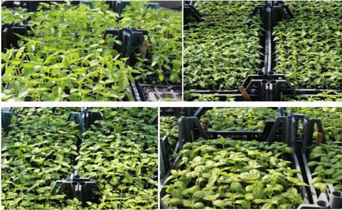
Şekil 3.6. Tarlaya şaşırtılmadan önce fesleğen fidelerinin son durumu (01.06.2015)