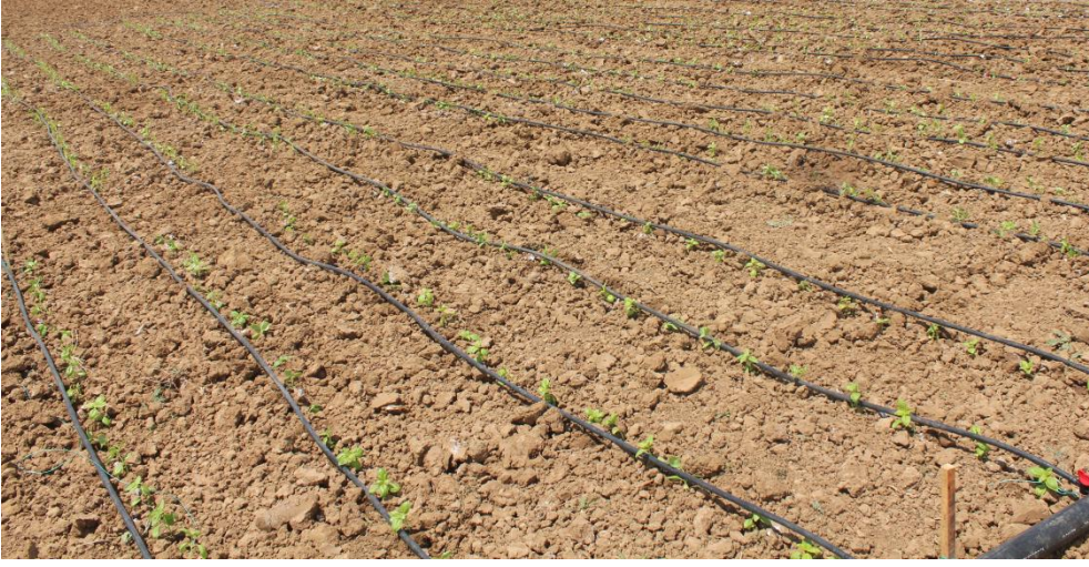
Şekil 3.7. Yeni dikilmiş fesleğen fidelerinin tarladaki görünümü