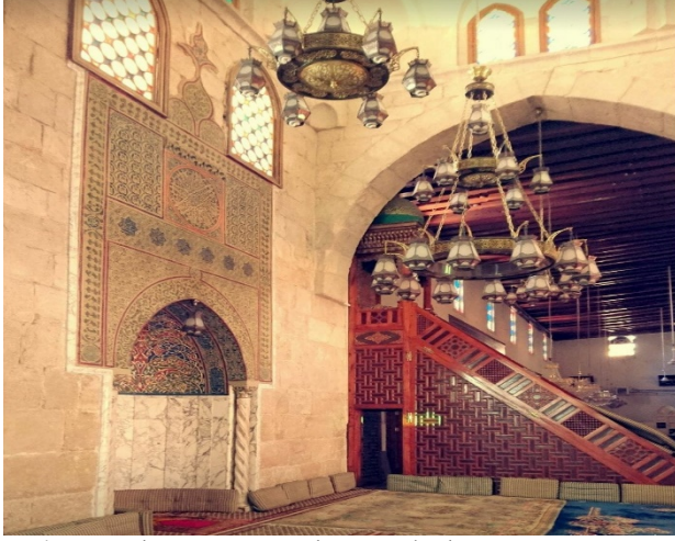
Resim 3. Töve Camiinin minber ve mihrabı 78 .