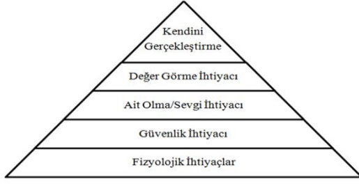
Şekil 2. Maslow'un ihtiyaçlar hiyerarşisi

Metinde fiziksel doğum ve beslenmenin ardından kahramanın manevi dünyasının gelişimine dikkat çeken ibare ise; “Dede ve nine onu çok iyi beslemekle kalmamış, ona iyi bir eğitim de vermişler” (Keleşoğlu, 2000, s. 10) şeklinde geçmektedir. Böylelikle olağanüstü doğum aşaması bitmiş ve kahraman manevi eğitimi temsil eden aşamaya geçilmiş olur. Masalın bu kısmında fiziksel olarak donanımlı olmanın yanı sıra manevi olarak da örnek teşkil etmek düşüncesi okuyucuya/dinleyiciye aktarılmıştır. Metinde Momotaro, nazik ve kibar olarak betimlenirken tüm köyün onu sevdiği özellikle vurgulanmıştır. Kahraman arketipi bu vesileyle hem fiziksel olarak hem de çevresine uyumlu bir birey olarak benliğin nasıl oluşması gerektiğinin yansıması halini almıştır. Fakat kahraman bu bütünlüğü sağlamak adına daha aşkın bir amacı yerine getirmeli ve bireyselliğin üstünde bir aşamaya geçerek toplumsal bir faaliyette bulunmalıdır. Campbell'in ilk eşik olarak adlandırdığı bu aşamada Momotaro ailesine “Şeytan Adası”na gitmek istediğini söyler ve eşiği aşmış olur. Kendi kararlarını vermek ve uygulamak isteyen benliğin ilk eşiği aşması ve evinden ayrılması Campbell'e göre yola çıkış aşamasının başladığı anlamına gelmektedir.